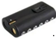
MPRLBP ・ Li-ion バッテリー