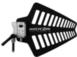
LBNA2 ・ 指向性アンテナ