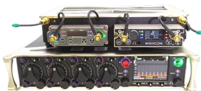
Sound Devices 888 with SL-2