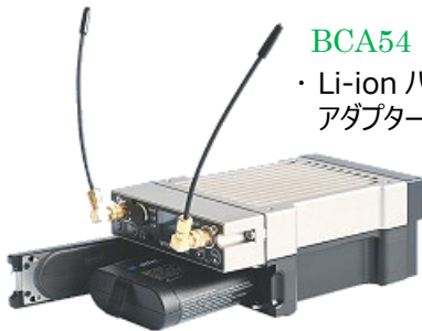
バッテリー : RRC2040