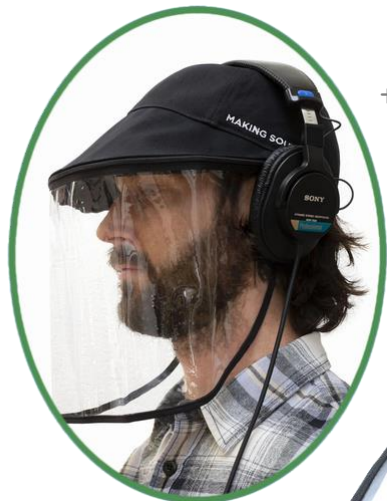
ザ・バイザーキャップ -ワイド