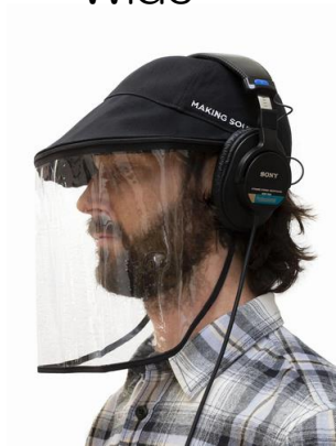
ヘッドフォン装着イメージ