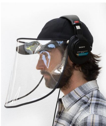
ヘッドフォン装着イメージ