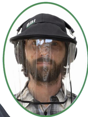
The Visor Cap - Wide -