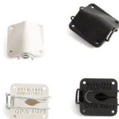
■ DPA 4071 用