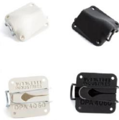
■ DPA 4060 用