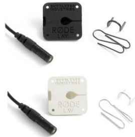
■ RØDE Lavalier 用