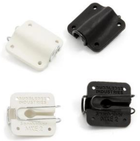
■ Sennheiser MKE2 用