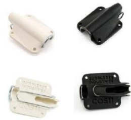
■ Sanken COS-11 用