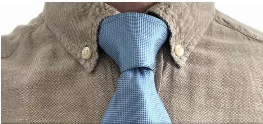
THE LAV CONCEALER FOR SENNHEISER MKE 2