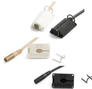
■ DPA 6060 用