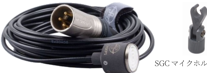
SGC マイクホルダー付属

CMC 1K は、Colette マイクロフォン・アンプ本体からケーブル (5m) が直接伸びている、形状最小となるモデルです。XLR コネクターが直接配線されている以外に、CMC 1K は CMC 1L とまったく同じです。