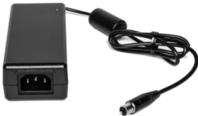
XL-WPTA4 ・ 8 Series 用 AC 電源アダプター (60W)