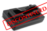
RRC-SMB-UBC ・ RRC バッテリー専用充電器 (AC 電源アダプター付属)