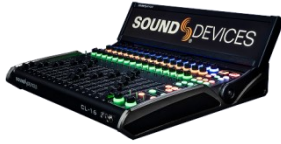
CL-16 ・ USB 接続フィジカル・コントローラ