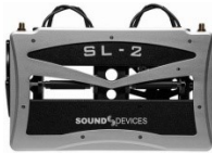
SL-2 ・ ワイヤレス・レシーバーオプション (2 slots)