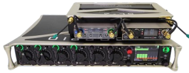
・ 装着例 (SL-2 on Scorprio)