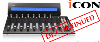
・ PLATFORM M+ と D2 ディスプレイ