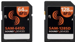
SAM-64SD / SAM-128SD ・ 64GB / 128GB approved SDXC カード (製品には同梱されません。) ・ 8 Series の SD カードスロット 2 基にそれぞれ 1 枚ずつ装着可能