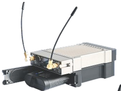
MCR54-B3 with BCA54

■ AWS-xx ホイップアンテナ(SMA) ・AWS-BK: 470-608MHz ・AWS-GN:670-870MHz