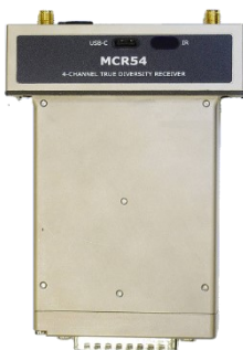
MCR54-DUAL-B3 with SL54-IK