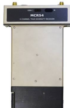
MCR54-DUAL-B3 with BPA54