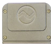
バッテリー挿入面